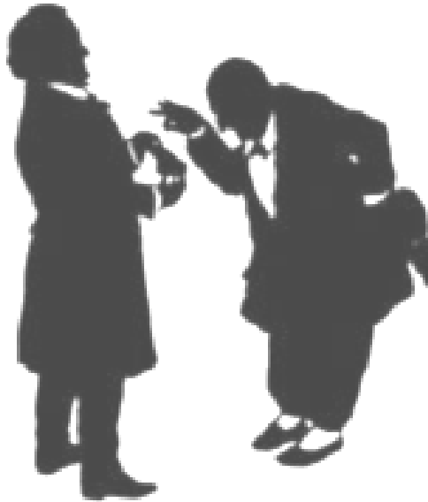
Bruckner ontmoet Wagner

de kunst van de instrumentatie kennen. Vooral het werk van Wagner maakte een diepe indruk op Bruckner.